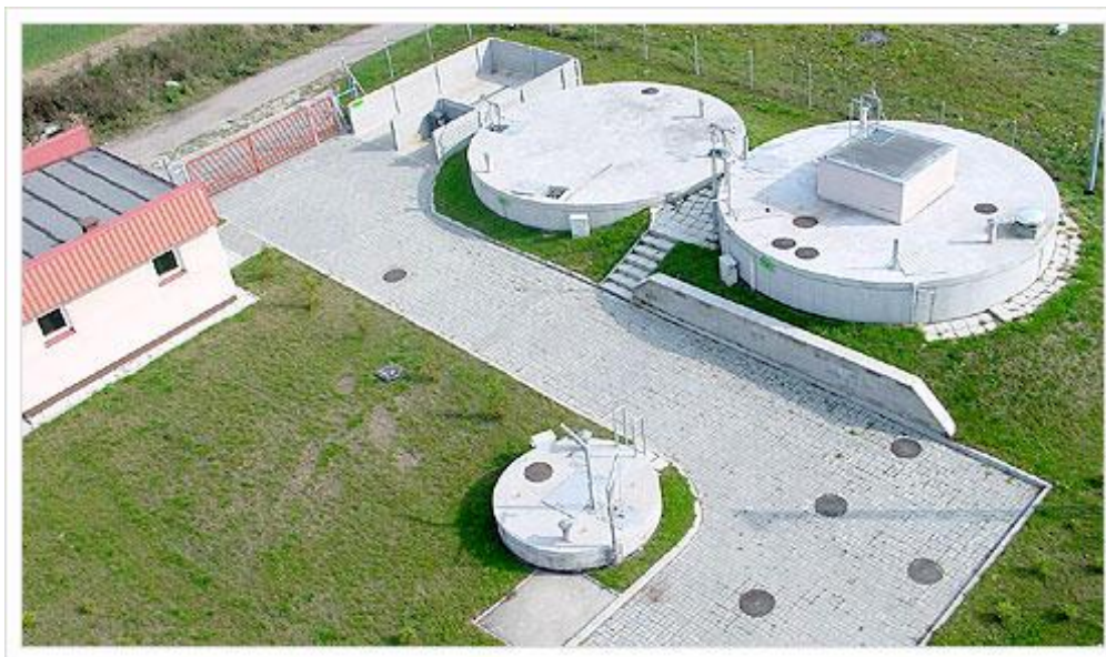
Oczyszczalnia ścieków w Turostowie

Wieś wyposażona we wszystkie media. Jest woda z hydroforni w Rybnie Wielkim. Jest kanalizacja i przepompownie ścieków do oczyszczalni w Kiszkanie.