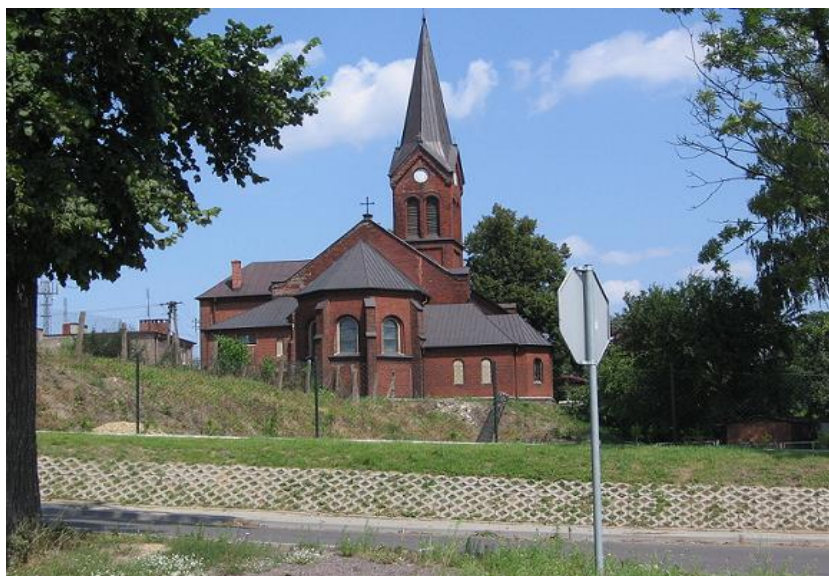
Kościół pw. Serca Pana Jezusa

Wiele interesujących obiektów sakralnych znajduje się także w pozostałych miejscowościach na terenie gminy. Godne uwagi są również: drewniana kaplica cmentarna w Sławnie z 1785 r., drewniany kościół w Łagiewnikach Kościelnych z 1741 r. oraz leżące w sercu Puszczy Zielonki Sanktuarium Matki Bożej w Dąbrówce Kościelnej, do którego przybywają całe rzesze pielgrzymów. Pierwsze wzmianki o tym sanktuarium pochodzą już z 1520 roku.