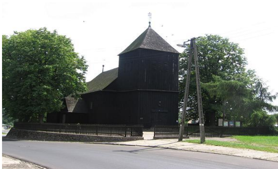
Kościół Parafialny p. w św. Jana Chrzciciela

Piękny kościół po ewangelicki z około 1890 r.